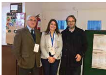
Saúde em debate nas Jornadas de Saúde de Trás-os-Montes e Alto Douro