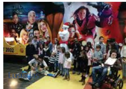
Fundação Social Bancária distribui sorrisos em época de Natal