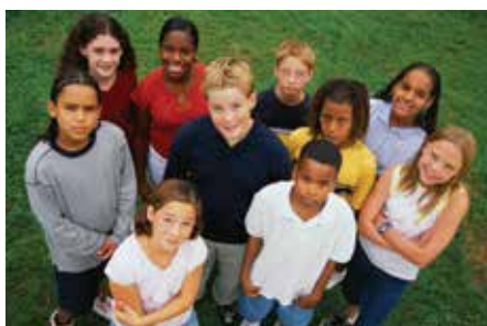
Coimbra recebeu sessão de formação de combate ao bullying