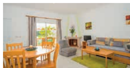
ALDEAMENTO ALDEIA DA GALÉ Praia da Galé/Salgados

Período de reserva: esta unidade está disponível de 1 de abril a 31 de outubro de 2023.