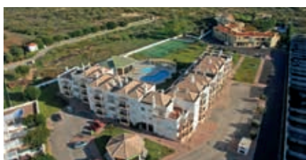
PRAIA DA LOTA APARTMENTS Praia da Lota (Manta Rota)

O Praia da Lota Resort fica localizado apenas a 100 metros de uma das mais belas praias do Sotavento algarvio. A sua areia dourada e águas cristalinas são os símbolos desta praia maravilhosa. Apartamentos confortáveis, com uma localização privilegiada junto da Praia da Lota. O Praia da Lota Resort oferece-lhe um ambiente tranquilo e familiar, com um grande terraço e piscina exterior, com piscina separada para crianças, jardim e um snack-bar, onde pode desfrutar de refeições ligeiras e cocktails.