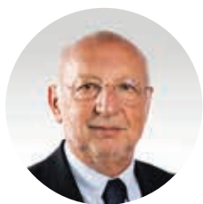
Joaquim Casa Nova Presidente da Mesa Unificada